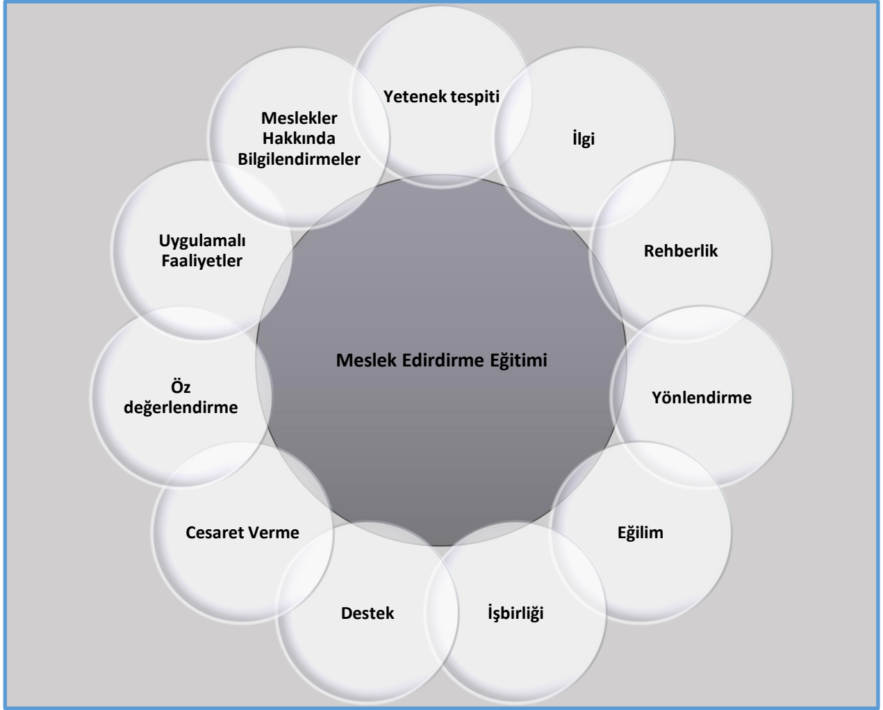
Şekil 2. Meslek edindirme eğitimi sürecine ilişkin bulgular

Araştırmanın “Görme engelli çocukların topluma uyum sürecine ilişkin ilişkin meslek edindirme eğitimi sürecine ilişkin öğretmenlerin görüşleri nelerdir?” alt problemine ilişkin olarak öğretmenlerle yapılan görüşmeler neticesinde elde edilen bulgular Şekil 2’de gösterilmiştir.